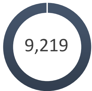
Gráfica DNAU 01-25. Solicitudes de reclamos admitidas