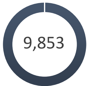
Gráfica DNAU 01-25. Solicitudes de reclamos admitidas